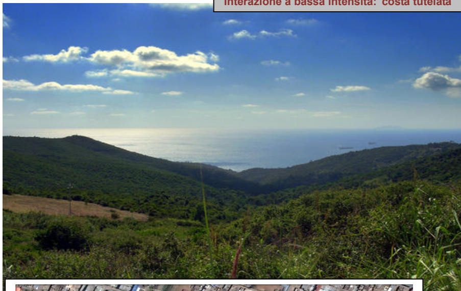
Interazione a bassa intensità: costa tutelata