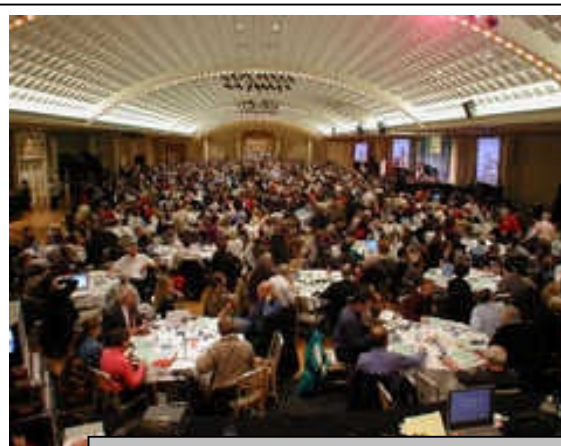
Regione toscana: town meeting sul paesaggio