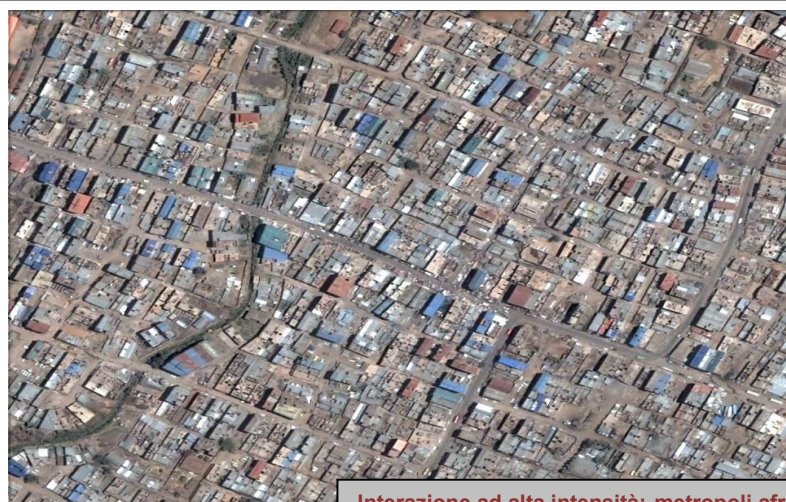
Interazione ad alta intensità: metropoli africana

Fulvio Bondi & Marcello Canovaro Architetti Associati Via Ricasoli 118 57126 Livorno Tel. 0586 899755 Fax. 05860893540